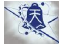
圖 1 國立彰化師範大學工教系系徽

標題超過一行，則與標題第一行第一個字上下切齊，圖內之字體大小可依實際需要設定，但整體應以清晰可讀為基本原則，如圖 1 所示。