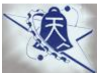
圖 1 國立彰化師範大學工教系系徽

文章格式請以 A4 紙格式撰寫，每一頁請用兩欄格式，行距使用單行間距，上下邊界留白各 2.54 cm 與 1.9 cm，左右邊界留白各 1.9 cm 與 1.32cm，欄寬 8.3 cm，兩欄間距 0.9 cm。